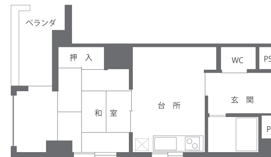
△Cタイプ (家賃55,000) 39.82 m 2